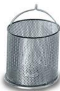
Comandi 24V con timer Cavalletto e filtro opzionale Cesto asciugaverdura opzionale